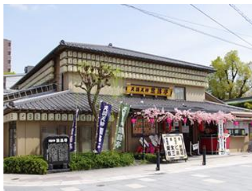
天満天神繁昌亭付近